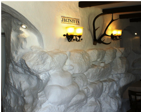
Jagstuens kampestens grundmur