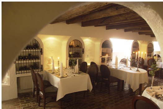
Fadeburet er i dag restaurant