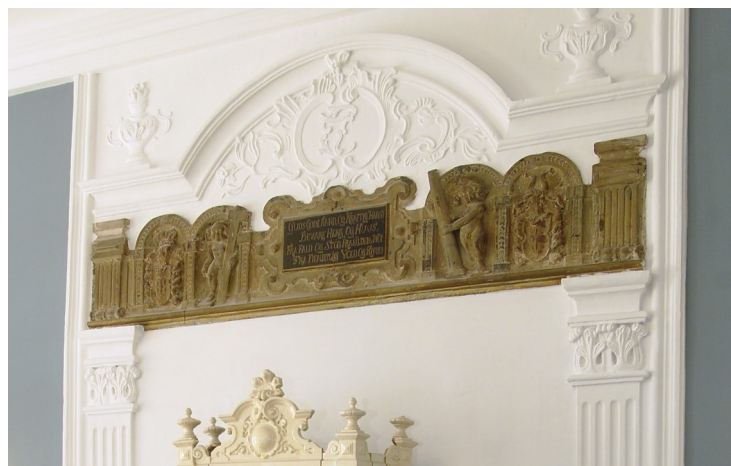
Kaminestue med våben og motto