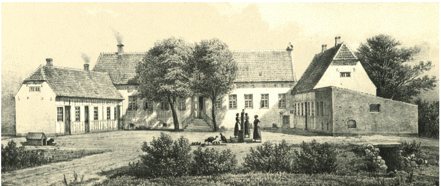
Vraa år tegnet 1865 F. Richard